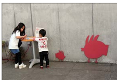
スタンプの置かれたシルエットBIRDの場所は5カ所。館内外を探し回る子供たち。

4月6日、桜満開の四季文化館「みの〜れ」にて、「小美玉さくらフェス」が開催。BIRDワークショップも参加しました。「みの〜れ」の施設の中に点在するBIRDのモニュメントを探すスタンプラリーには、100人以上の子供たちと保護者の皆さんが参加されました。ゴールは、100種類のBIRD作品が展示してあるBIRD美術館。直接作品に触れながら自分の好きなBIRDにシールを貼ってもらうという人気投票プログラムも実施。後日1位〜3位を見事当てたら特性BIRDバッチがプレゼントされるという企画も。改めて「みの〜れ」のシンボルでもあるBIRDを楽しんでもらえました。今後も、住民の皆さんに愛されるBIRDとしての活動を積極的に進めていきたいと思ひます。