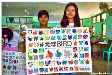
当日配布したお持ち帰り地球BIRDぬり絵カード(上2点)。自宅であってBIRD WEB美術館にたくさんの投稿いただきました。

ぬり絵をしてくれたミャンマーの子供たちから届いた写真です。学校が春休みのとき、約200人の子供たちがBIRDワークショップを体験してくれました。特定非営利活動法人ジャパンハート様の養育施設Dream Trainで自立支援を受ける子供たちです。民族衣装のカラフルさがぬり絵にも表現されています。