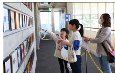
2階のBIRD美術館で自分の好きなBIRDを選ぶ人気投票。兄弟でも選ぶBIRDはそれぞれ。