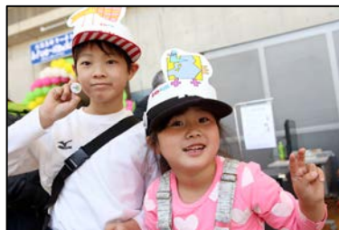
スタンプラリーのプレゼントはBIRD缶バッチ。100種類もあるので、選ぶことにも真剣な子供たち。