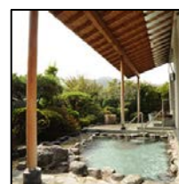
温泉で日常の疲れをとって、BIRDで非日常を味わって、存分に癒やされてリラックスしてください。